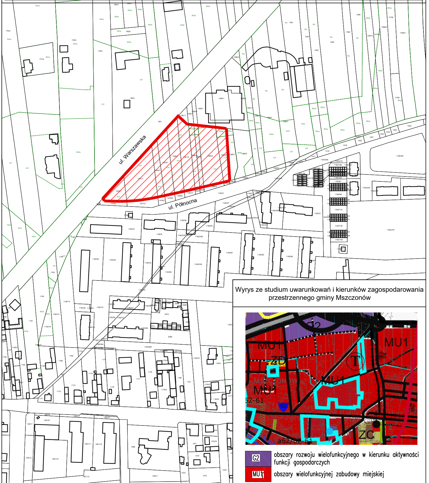
Wyrys ze studium uwarunkowań i kierunków zagospodarowania przestrzennego gminy Mszczonów

obszar objęty projektem planu miejscowego